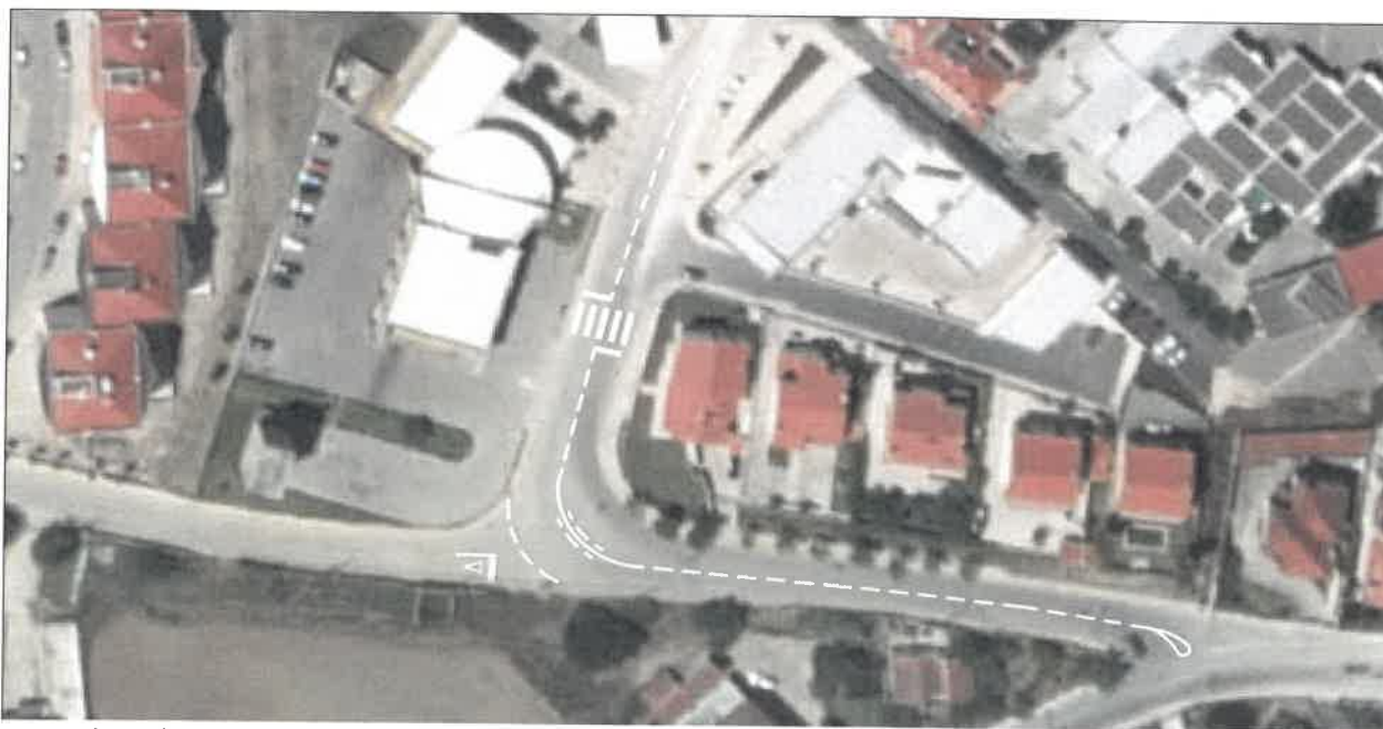
Nova situação a vigorar após conclusão da sinalização vertical e horizontal.

Esta alteração justifica-se atendendo aos fluxos de tráfego que circulam em cada um dos destes arruamentos, será devidamente assinalada através da colocação de sinalização vertical e de sinalização horizontal (marcações rodoviárias no pavimento) adequadas e entrará em vigor a partir do momento em que a sinalização esteja concluída, tendo como objetivo melhorar as condições de circulação e de segurança rodoviárias deste local.